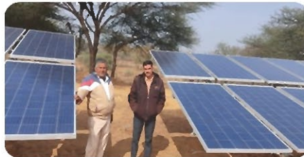
SPV Water Pumping System at Rajasthan

REIL has received & executed orders of SPV Water Pumping Systems (12 nos.) for different capacities in Rajasthan through Forest Department, Water Shed & PHED.