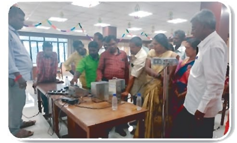
Training on Advance DPMCU by REIL officials.

REIL also organized the training on Advance DPMCU at Tamil Nadu Cooperative Milk Producers Federation Limited (TCMPF) Chennai and Milk Analyzer at Valsad Dairy, Gujarat for Milk Societies.