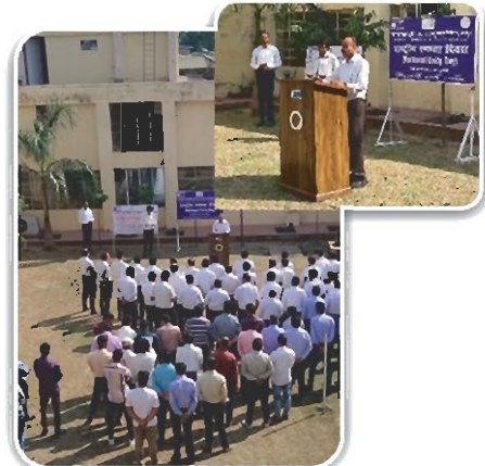
शपथ ग्रहण समारोह

हमारे राष्ट्र की एकता, अखंडता और सुरक्षा को बनाए रखने और मजबूती देने की दृष्टि से स्मरणों स्वरूप सरदार वल्लभभाई पटेल की जयंती 31 अक्टूबर 2023 को 'राष्ट्रीय एकता दिवस' के रूप में मनाया गया। इस अवसर पर सभी कर्मचारियों के लिए सरदार वल्लभभाई पटेल की जीवनी पर आधारित एक वीडियो फिल्म प्रदर्शित की गयी तथा सभी अधिकारीगण/कर्मचारीगण को सतर्कता जागरूकता सप्ताह के उपलक्ष्य में आयोजित शपथ दिलवाई गई। शपथ ग्रहण समारोह के पश्चात एकता दौड़ का आयोजन किया गया। जिसमें कम्पनी कर्मचारियों द्वारा भाग लिया गया।