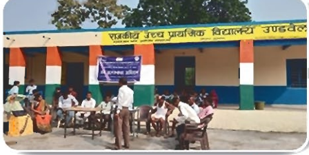
राजकीय उच्च प्राथमिक विद्यालय उडवेला में एक जन जागरूकता अभियान का आयोजन

एक जन जागरूकता अभियान का आयोजन दिनांक 21.11.2023 को किया गया जिसमें जनजातियों से संबंधित भारत सरकार की योजनाओं के बारे में बताया गया एवं भगवान बिरसा मुंडा की जीवनी पर सभी को अवगत करवाया गया।