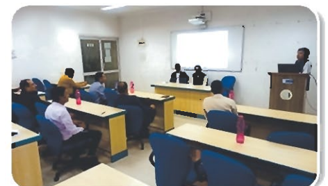
Vendors/Suppliers while attending the training program on BTS

Continuous support services were also provided for in-house developed solutions during the quarter. For the ease of operation on Bill Tracking System(BTS) for Suppliers, IT Division conducted a training program on proper usage of Bill Tracking System for Suppliers / Vendors on 30.11.2023 at REIL Factory Premises.