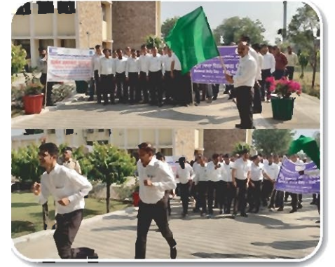
एकता दौड़ का आयोजन