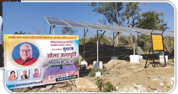
Hon'ble Governor of Rajasthan inaugurating the project setup by REIL at Piplantri on 20.12.2023

Hon'ble Governor of Rajasthan, Shri Kalraj Mishra inaugurated the project recently executed by REIL at developed village Piplantri of Rajsamand in Rajasthan. The project includes Grid connected SPV Power Plants at 15 nos. locations (8 KWp each) to feed power to the existing pump-sets and therefore the electricity charges will be minimised.