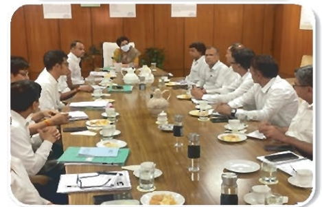
JS MHI, during an interaction with REIL officials on 06.11.2023

She also interacted with senior officials of the Company on different ongoing projects and projections for the year.