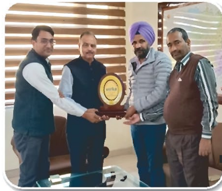
Glimpse of visit of MD REIL

The Managing Director reviewed the work being done by REIL and assured dairy officials that we will keep providing upgraded products and quality services.