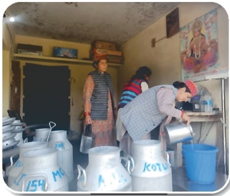
Milk Collection at MPCs Bhargaon, District Mandi, Himachal Pradesh

Apart from this, the Company received regular orders of 170 nos. of Electronic Milk Testers from Gujarat, Eastern, Southern & Rajasthan Region, 1104 nos. of Milk Analyzers from Central, Gujarat, Northern, Rajasthan, Southern & UP Region and an Automatic Electronic Milk Tester from Southern region.